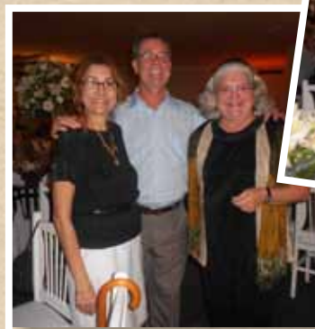
Festa Natalina da DS/RJ