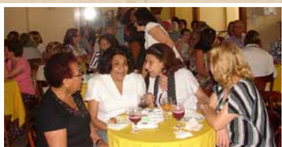
Celebrando a Vida!