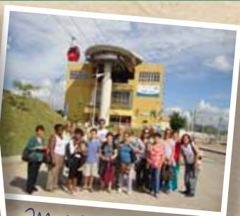
Morro do Alemão