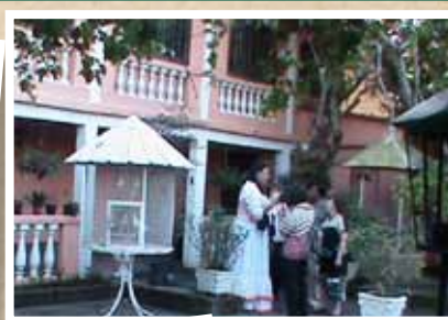
Casa do Pontal