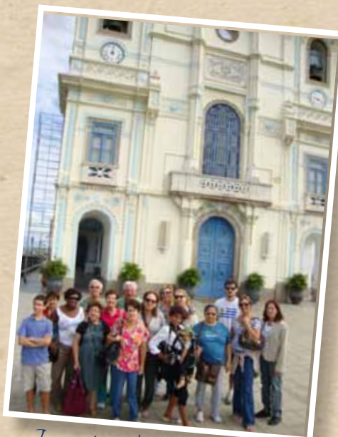
Igreja da Penha