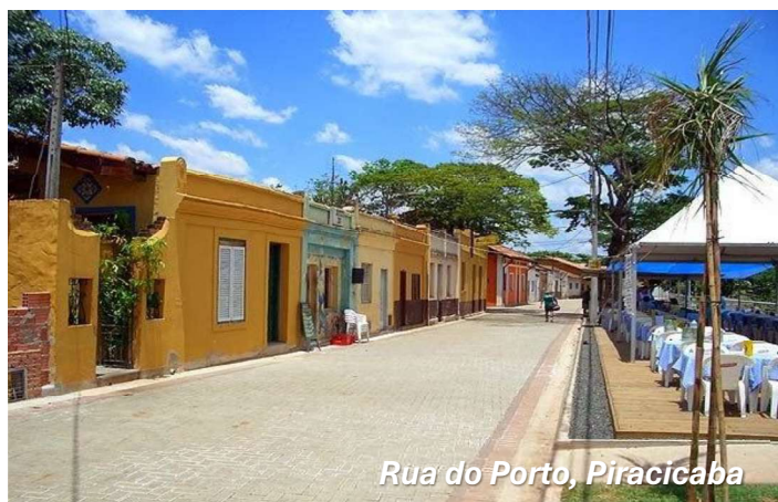
Rua do Porto, Piracicaba