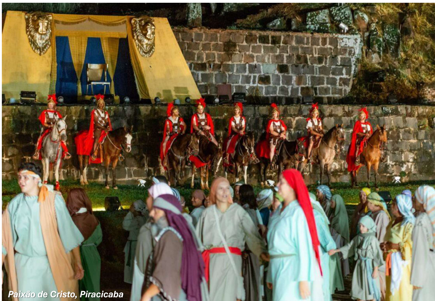
Paixão de Cristo, Piracicaba