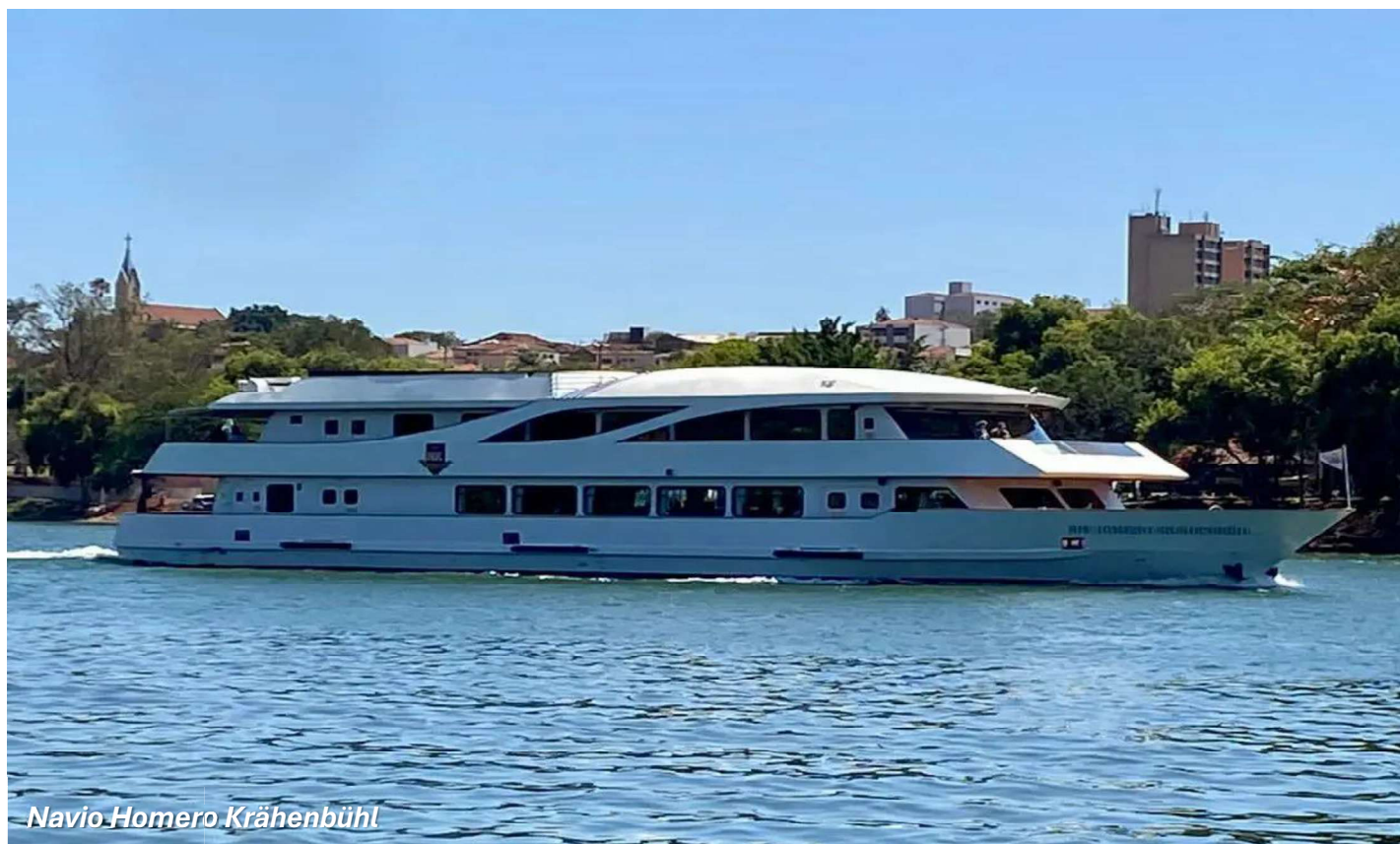
Navio Homero Krähenbühl

Importante: Caso haja algum impedimento por força maior na operação de eclusagem do Rio Tietê, o passeio será realizado sem essa operação e podendo ser alterado o itinerário.