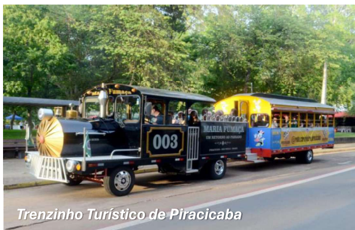
Trenzinho Turístico de Piracicaba

Saída do Rio de Janeiro em confortável ônibus de turismo, especial serviço de bordo e guia acompanhante credenciado pelo Ministério do Turismo com destino a Piracicaba, no interior de São Paulo. ALMOÇO em viagem incluso. Chegada e HOSPEDAGEM no Hotel Beira Rio ou similar